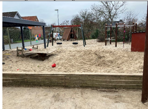
Redskab: Sandkasse Årgang: 2014 Producent: JRJ Er redskabet mærket: Ja Er der registreret fejl/mangler: Nej