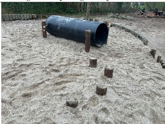
Redskab: Balance stolper /rør Årgang: 2011 Producent: Rudeco Er redskabet mærket: Ja Er der registreret fejl/mangler: Nej