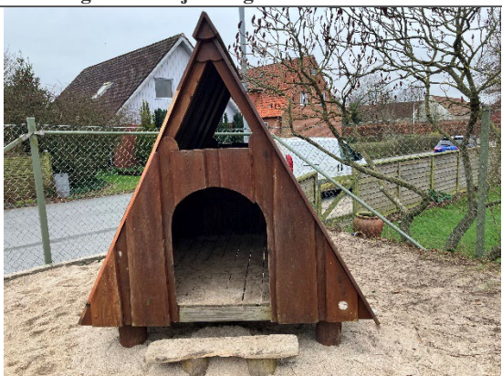
Redskab: Legehus Årgang: 2015 Producent: Bos legepladser Er redskabet mærket: Ja Er der registreret fejl/mangler: Ja