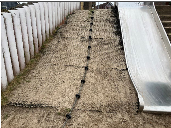
Redskab: Klatrereb Årgang: 2018 Producent: JRJ Ribe Er redskabet mærket: Ja Er der registreret fejl/mangler: Ja