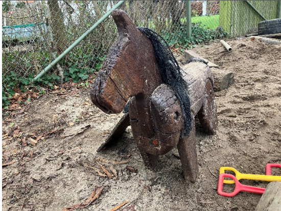
Redskab: Træ hest Årgang: 2009 Producent: Aktiv ude Er redskabet mærket: Ja Er der registreret fejl/mangler: Nej