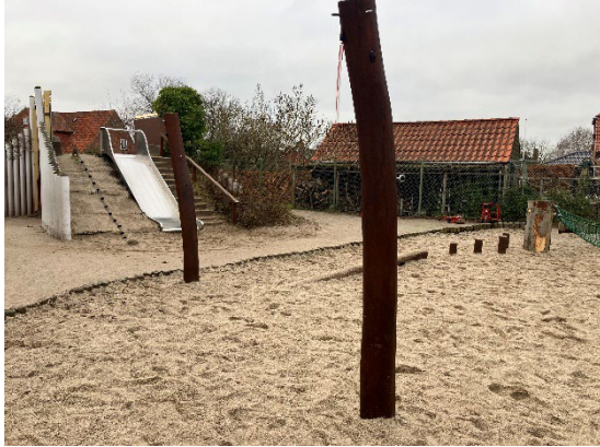
Redskab: Solsejlsstolper Årgang: 2015 Producent: Bos legepladser Er redskabet mærket: Ja Er der registreret fejl/mangler: Nej