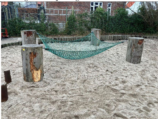
Redskab: Klatre-net Årgang: 2022 Producent: JRJ Ribe Er redskabet mærket: Ja Er der registreret fejl/mangler: Nej