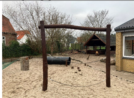
Redskab: Klatrerredskab Årgang: 2011 Producent: Rudeco Er redskabet mærket: Ja Er der registreret fejl/mangler: Nej