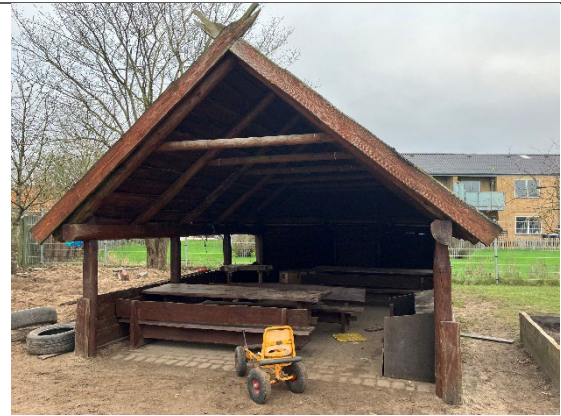
Redskab: Madpakkehus Ikke omfattet af DE/EN 1176