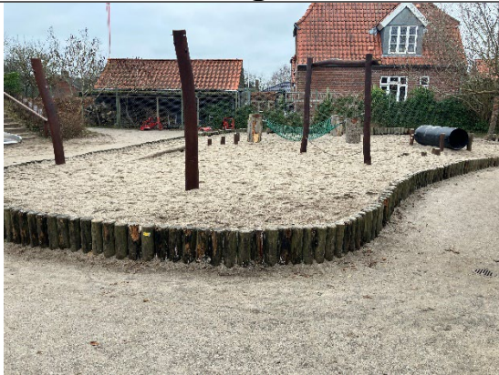
Redskab: Sandkasse Årgang: 2015 Producent: JRJ Ribe Er redskabet mærket: Ja Er der registreret fejl/mangler: Ja