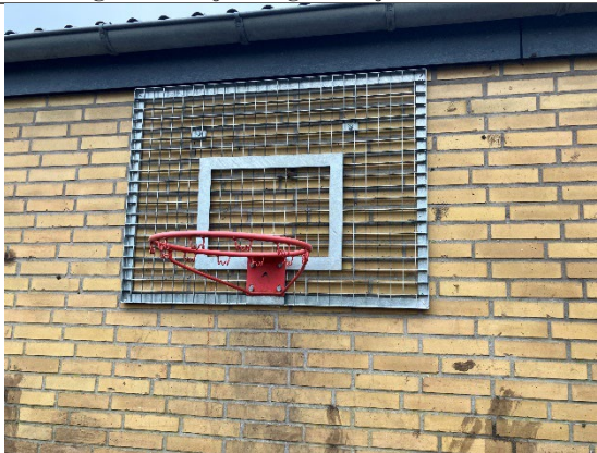
Redskab: Basketball Ikke omfattet af DE/EN 1176