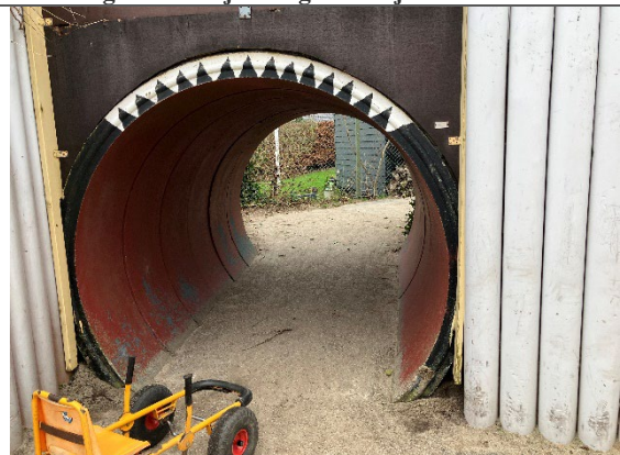
Redskab: Bro/ Tunnel Årgang: 1988 Producent: Egen produktion Er redskabet mærket: Ja Er der registreret fejl/mangler: Nej