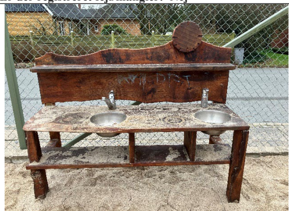
Redskab: Lege køkken Årgang: Producent: Er redskabet mærket: Nej Er der registreret fejl/mangler: Ja