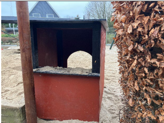
Redskab: Legehus Årgang: 2021 Producent: Egen produktion Er redskabet mærket: Ja Er der registreret fejl/mangler: Nej