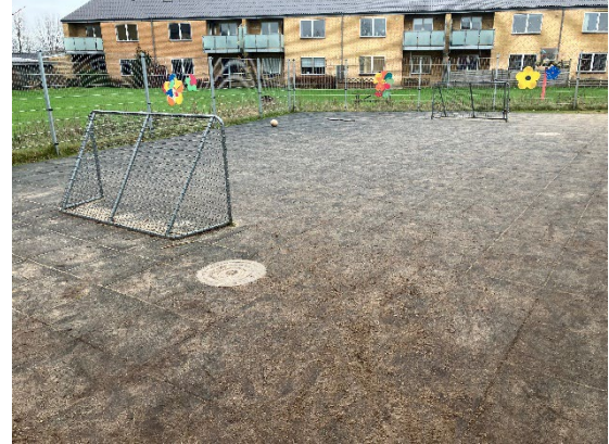
Redskab: Boldbane Ikke omfattet af DS/EN 1176