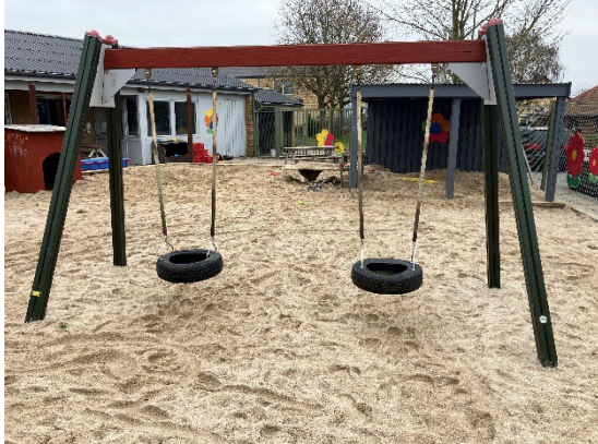
Redskab: Gyngestativ Årgang: 2006 Producent: Leika Er redskabet mærket: Ja Er der registreret fejl/mangler: Ja