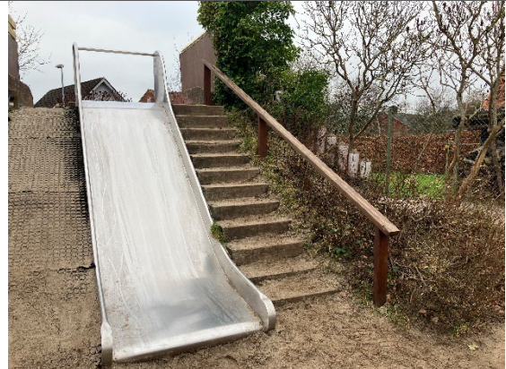
Redskab: Rutsjebane Årgang: 2004 Producent: Egen produktion Er redskabet mærket: Ja Er der registreret fejl/mangler: Nej