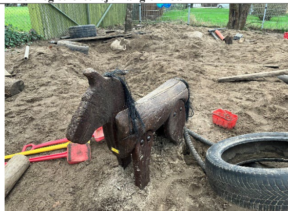
Redskab: Træ hest Årgang: 2009 Producent: Aktiv ude Er redskabet mærket: Ja Er der registreret fejl/mangler: Nej