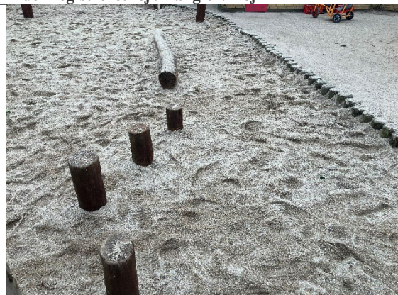
Redskab: Balance redskab Årgang: Producent: Er redskabet mærket: Nej Er der registreret fejl/mangler: Ja