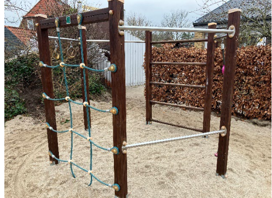
Redskab: Klatrestativ Årgang: 2017 Producent: Holzhof Er redskabet mærket: Ja Er der registreret fejl/mangler: Ja