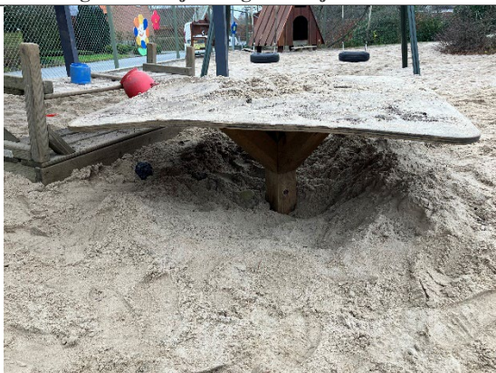
Redskab: Sandbord Årgang: 2014 Producent: Er redskabet mærket: Nej Er der registreret fejl/mangler: Ja