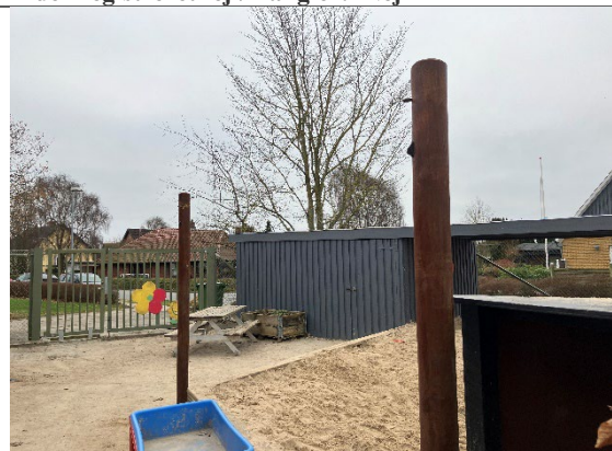
Redskab: Solsejlstolper Årgang: Producent: Er redskabet mærket: Nej Er der registreret fejl/mangler: Nej